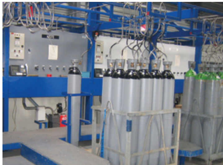
Polnilno mesto za najčistejše pline

Kadar polnimo jeklenke s čistimi plini, moramo upoštevati posebna navodila za polnjenje, da dosežemo ustrezno tehnično kakovost. Najprej moramo jeklenke ustrezno pripraviti. Zahteve strogih specifikacij čistih plinov lahko dosežemo samo v jeklenkah z neoporečnimi notranjimi površinami.