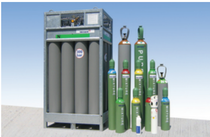
Raznolikost tlačnih posod – od tlačne doze do snopa

Standardne oblike dobave so navedene na tehničnih specifikacijah. Količina plina je pri vsaki obliki dobave navedena v m 3 oz. kg.